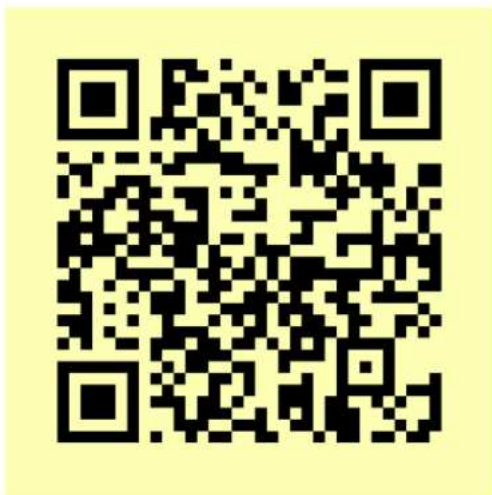
QR-Code zu den WhatsApp News

Dem WhatsApp News-Channel könnt ihr einfach über den QR-Code beitreten (Mit der Handykamera oder einer QR-Scanner-App scannen und dem Link folgen).