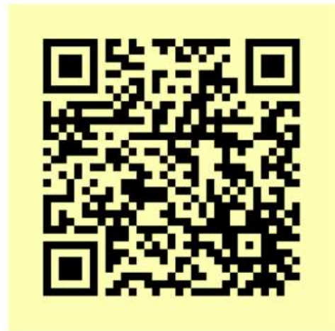
QR-Code zum WhatsApp-Liveticker

Auch für den Liveticker könnt ihr den QR-Code scannen, oder über den WhatsApp-Kanal beitreten. Dort ist die Liveticker-Community in der Kanalinfo verlinkt → einfach anklicken und beitreten.